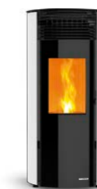
BLANCO OPACO Blanc opaque Dimmed white