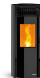
NEGRO Noir Black

Pensada para quienes buscan calidez sin renunciar al diseño, esta estufa de 12 o 14 kW combina potencia y elegancia para climatizar espacios amplios con eficiencia y estilo. Su diseño de formas redondeadas envuelve el ambiente y realza cualquier estancia, integrándose con carácter en la decoración.