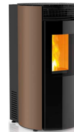
EFECTO ÓXIDO Effet oxyde Rust look